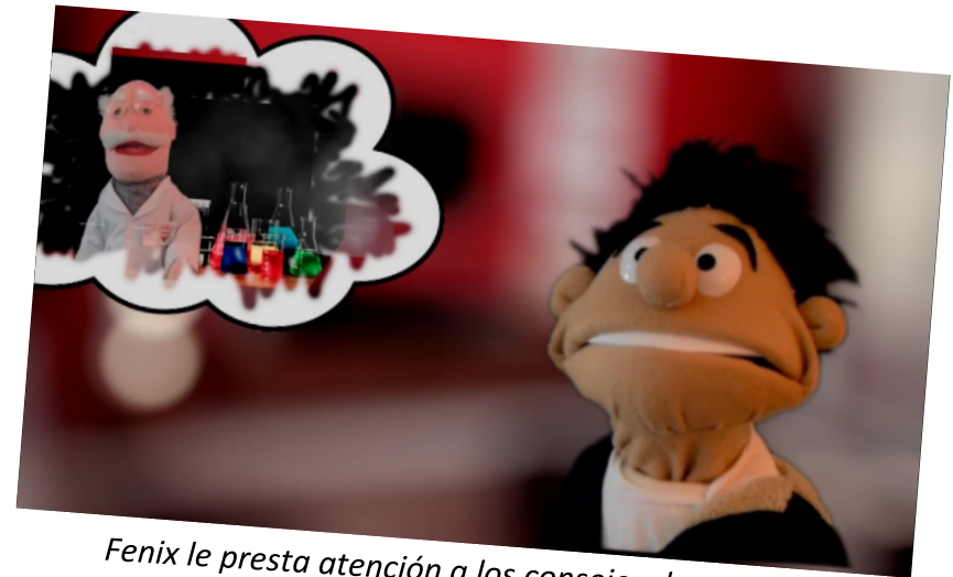
Fenix le presta atención a los consejos de su profesor