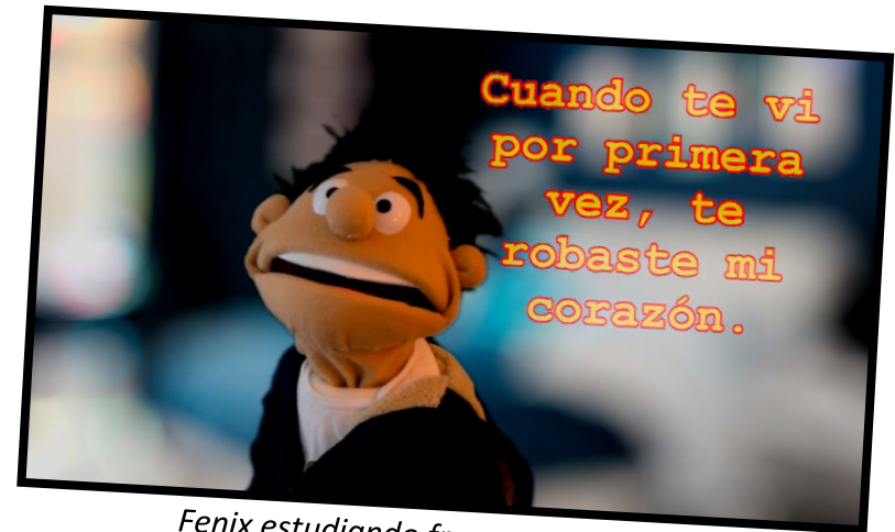
Fenix estudiando frases ganadoras...

Responde todas las preguntas que puedas. Si necesitas, puedes mirar el video más veces.