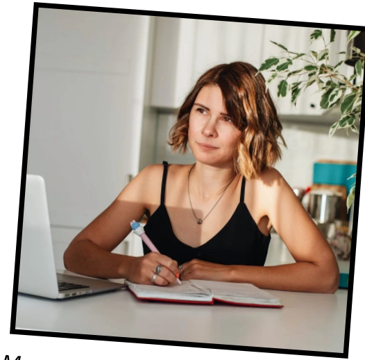
Momento de organizar nuestras ideas