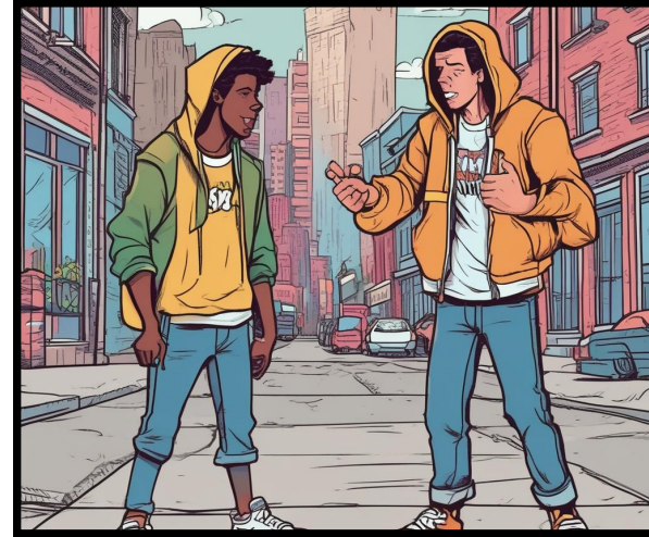
Una discusión de amigos