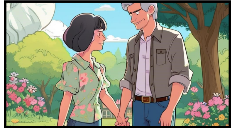
Un amor impensado.

Responde todas las preguntas que puedas. Si necesitas, puedes escuchar el audio más veces.